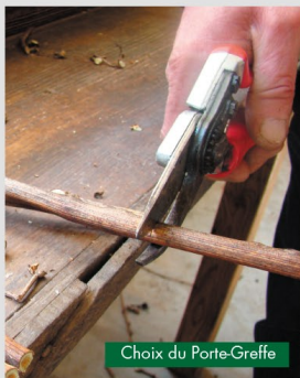
Choix du Porte-Greffe