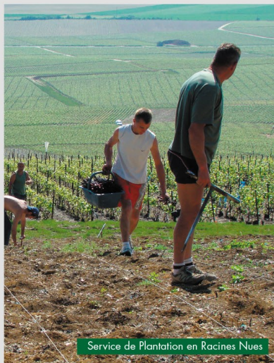
Service de Plantation en Racines Nues